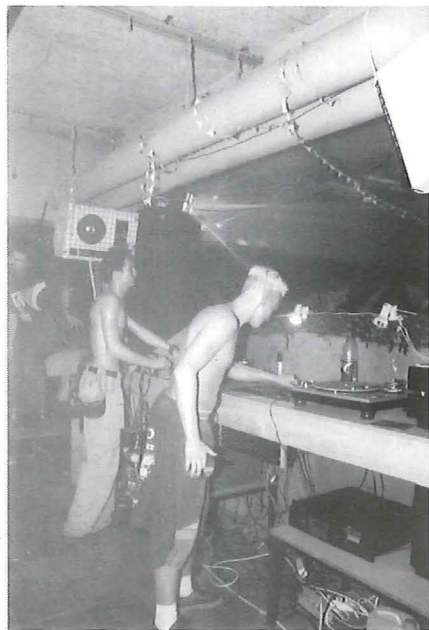
Grootse metamorfose in de kelder

'M'n fiets is weg,' roept een op toeren geraakte feestganger. Het is duidelijk dat deze passant meer interesse toont voor de bar dan een goed gesprek met de reporter.