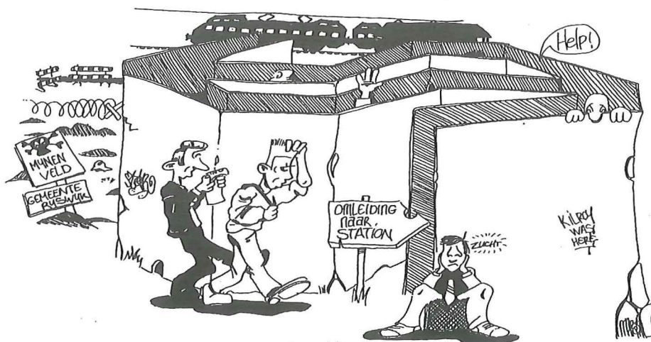
DE ROUTE NAAR STATION RIJSWIJK, ANNO '92.